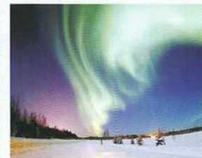
Aurore polaire - Educol.net