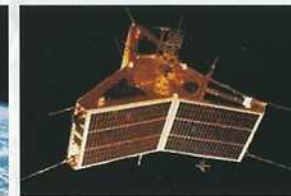
AMSAT - Satellite Relais Oscar 10