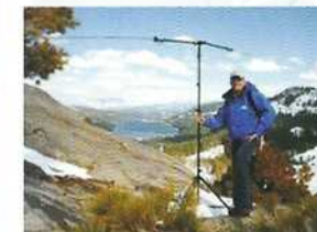
Antenne portable pour liaisons mondiales

Téléphonie, télévision ou transfert de données... Réflexion des ondes sur l'ionosphère, sur la Lune... Transmissions par satellites radioamateurs ou relais hertziens, radiolocalisation, code Morse, le tout sur un vaste choix de fréquences autorisées !