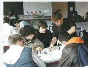
Collège H.Dunant - Rueil-Malmaison (92)