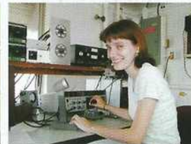
Correspondante de Pennsylvanie / USA