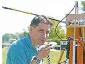
Station autonome de campagne

Découvrir des personnes partageant la même passion dans toutes les régions du monde... et entrer en communication par radio avec eux grâce à l'installation que l'on a assemblée, tout en pratiquant les langues étrangères...!