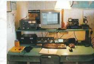
Utilisation intensive de l'informatique