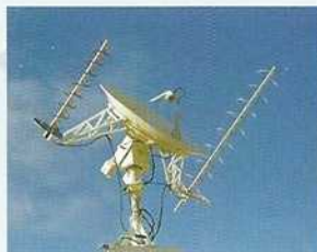
Los Alamos Laboratory