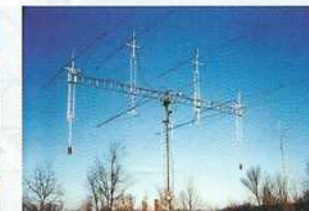
Viser la Lune...