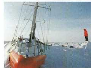
Expédition TARA - F.Latreille

Comprendre les phénomènes atmosphériques grâce aux ondes radio. Aurores boréales, chutes de météorites, magnétosphère... Découverte par deux radioamateurs en 1923, l'ionosphère permet d'établir des liaisons radio mondiales en fonction des saisons et de l'heure de la journée !