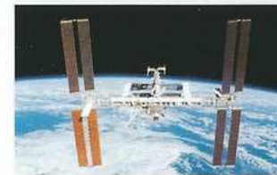
NASA - International Space Station

Entrer en contact avec la station spatiale ISS et utiliser de véritables satellites radioamateurs conçus par des élèves d'universités techniques.