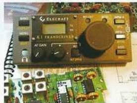
Emetteur en kit