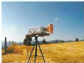
Liaison radio 5,7 GHz